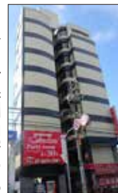
<ビッグウエスト向島ビル外観>