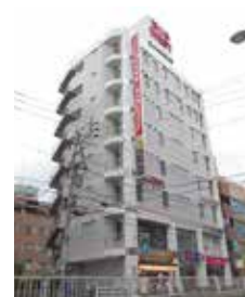
<ビッグウエスト浦安ビル外観>