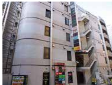
<ビッグウエストかさいビル外観>