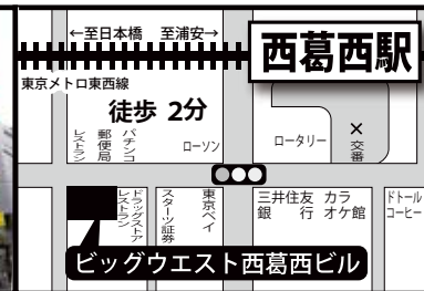
東京都江戸川区西葛西 6-9-10