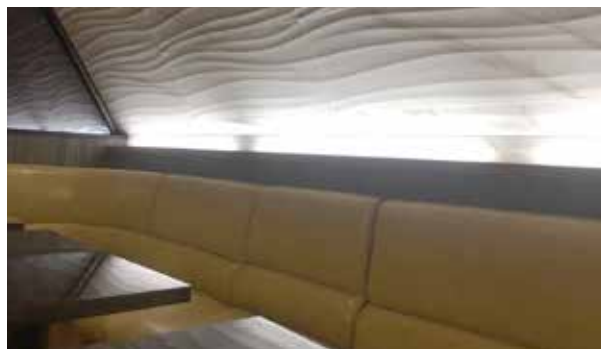
諸条件、業種、その他お気軽にご相談ください。