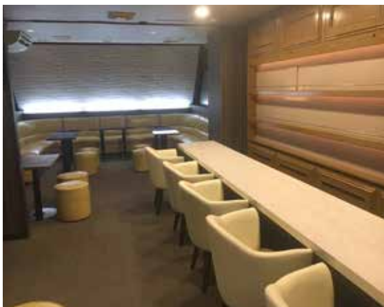
ローカウンターが特徴