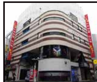
ビッグウエスト西葛西ビル