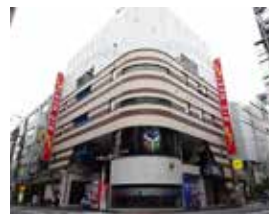
ビッグウエスト西葛西ビル