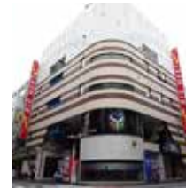
ビッグウエスト西葛西ビル