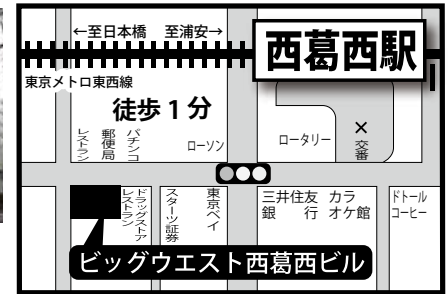
東京都江戸川区西葛西 6-9-10