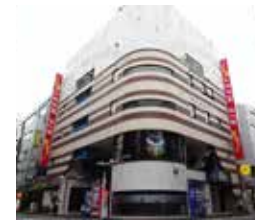
ビッグウエスト西葛西ビル