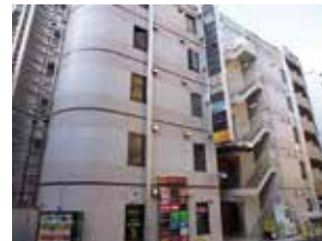
<ビッグウエストかさいビル外観>