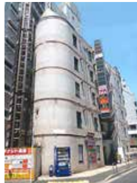
<ビッグウエストかさいビル外観>