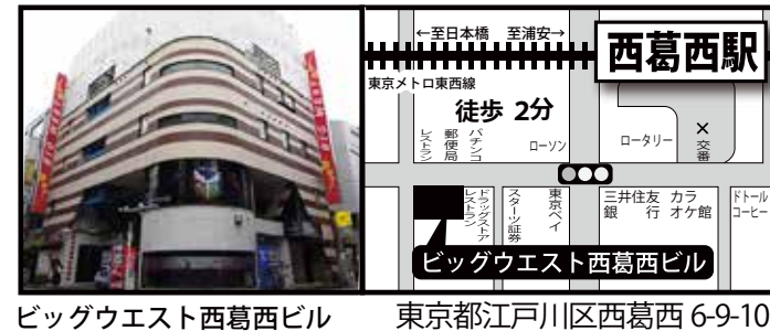
ビッグウエスト西葛西ビル 東京都江戸川区西葛西 6-9-10

デジタルサイネージで店のCM動画配信 <15秒の動画コンテンツ制作費もサービス!> さらに看板使用料も無料