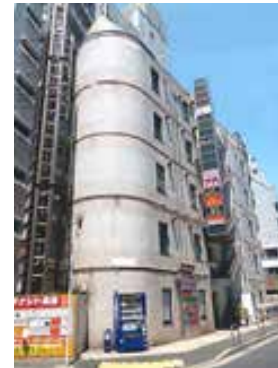
<ビッグウエストかさいビル外観>