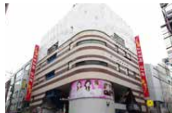
<ビッグウエスト西葛西外観>