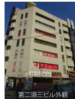
第二須三ビル外観