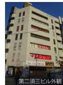
第二須三ビル外観