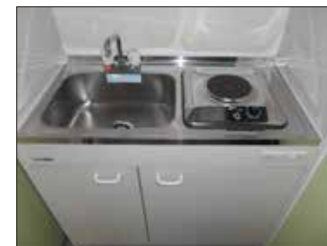
事務所・軽飲食店等