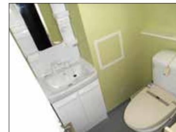
トイレ・ミニキッチン